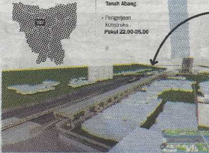
Rancangan skybridge Pasar Tanah Abang Bird Eye View- Blok G.